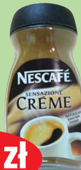
Kawa Nescafe Creme rozpuszczalna 200g